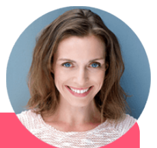
Julia Assistante Virtuelle

Tout au long de leur expérience, les célibataires savent qu'ils peuvent compter sur Julia, le bot conversationnel DisonsDemain ! Elle leur partage des conseils pour utiliser au mieux le service, leur recommande des profils... et leur donne même rendez-vous pour des sessions de Speed Dating auxquelles ils sont plus de 1400 à participer chaque lundi ! Bref, Julia est devenue leur alliée préférée dans leur quête de rencontre, chaque jour ils sont d'ailleurs 8500 à échanger avec elle !